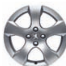
Легкосплавний колісний диск 17" SAVARA