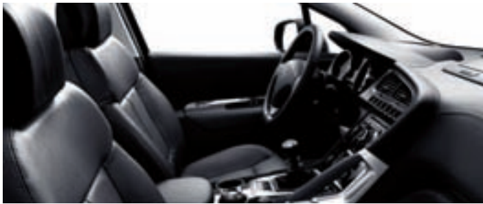
Cuir intégral Tramontane*