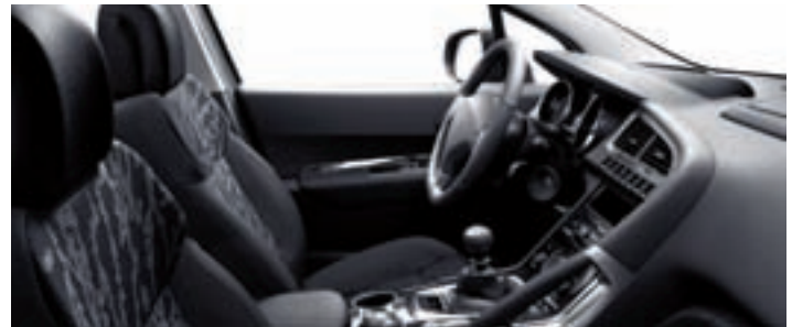
Chaîne et trame Ombrage Tramontane