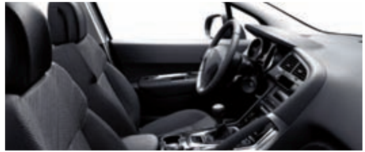
Chaîne et trame Sibayak Tramontane