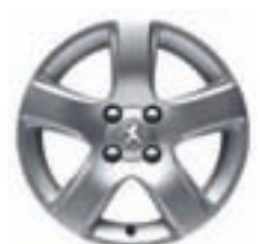
Легкосплавний колісний диск 16" ISARA (ексклюзивно поєднаний з Grip Control® (опція). Посилена рухомість.