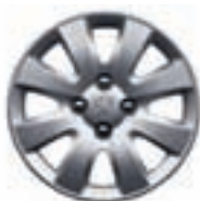
Ковпак Hobart 15"