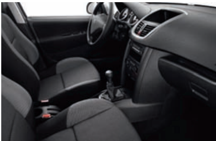
Варіант оздоблення салону з тканинною оббивкою (Chilico Noir Mistral)