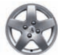
Колісний диск Mopaco 15"