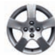
Колісний диск Canberra 16**