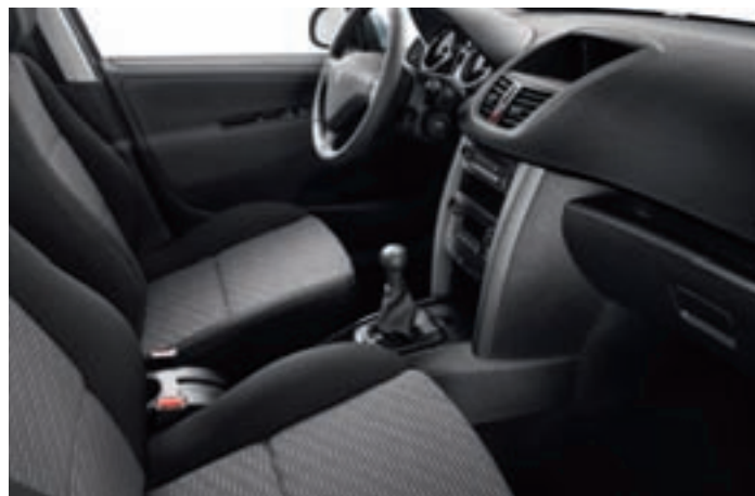
Варіант оздоблення салону з тканинною оббивкою (SPA Noir Mistral)